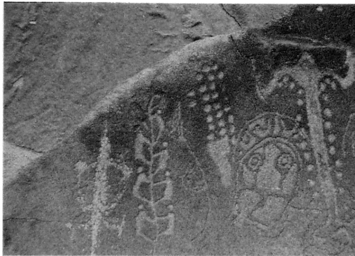
Rotskunst in Dampier Rock Art Precinct.

Afgelopen januari bezochten we UNESCO in Parijs om daar van de deskundigen uitleg te krijgen over werelderfgoed. In het Val de Loire kregen we een voorbeeld te zien van een 'levend cultuurlandschap': een landschap gevormd door de interactie van mens en natuur. Het tweede deel van het uitwisselingsprogramma vindt plaats in Perth (Australië). Hier loop ik onder andere een stage bij de National Trust of Australia met als onderwerp bedreigde rotskunst. Een onderwerp waar we in Nederland ook van kunnen leren hoe we beter om zouden kunnen gaan met het landschap waarin we leven.